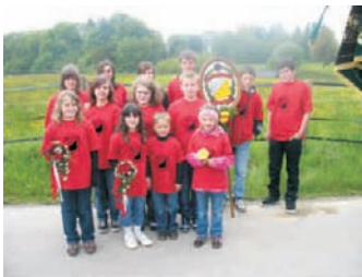
Egg'er Jungschützen mit neuem T-Shirt

Rechtzeitig zum Schützenumzug in Tafertshofen eingeladen als Gastverein, bekommen die Jungschützen kostenlos ein T-Shirt mit ihrem eigenen Namen (angebracht am Ärmel) gestellt. Auf der Vorderseite des T-Shirts befindet sich das Wappen des SVE.