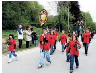
Schützenumzug in Tafertshofen